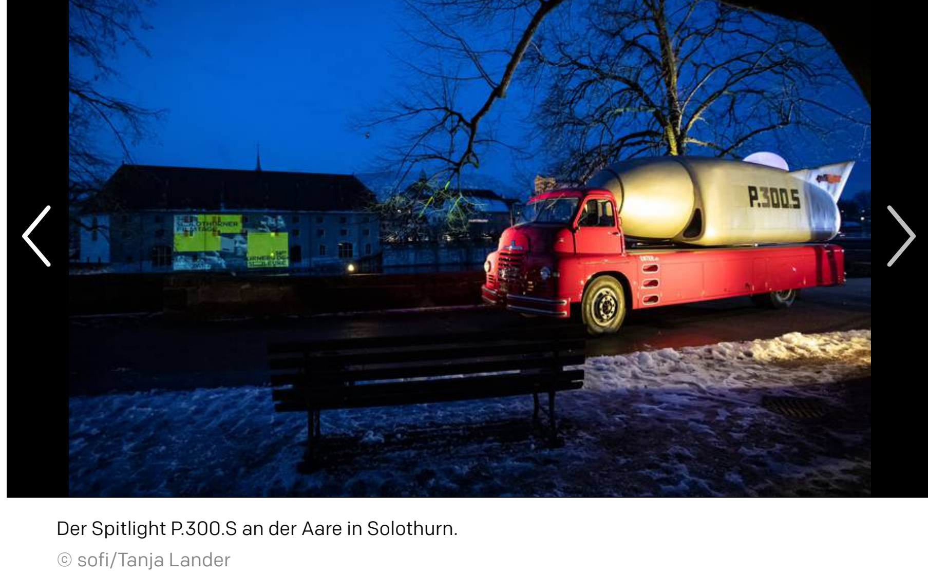
Der Spotlight P.300.S an der Aare in Solothurn.